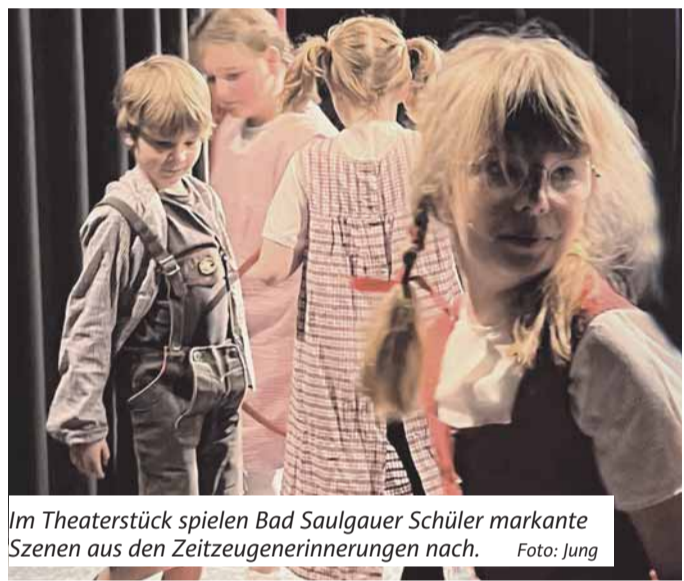
Im Theaterstück spielen Bad Saulgauer Schüler markante Szenen aus den Zeitzeugenerinnerungen nach.