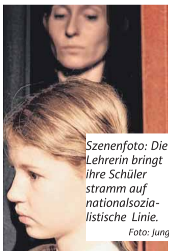
Szenefoto: Die Lehrerin bringt ihre Schüler stramm auf nationalsozialistische Linie.