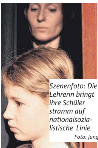
Szenenfoto: Die Lehrerin bringt ihre Schüler stramm auf nationalsozialistische Linie.

Über 100 Zeitzeugen meldeten sich. Kriegsteilnehmer, die jahrzehntelang unter einem Trauma gelitten hatten und nie über ihre Erlebnisse sprechen konnten, fanden plötzlich die Kraft, sich alles von der Seele zu werden. Kinder, Enkel und Urenkel wurden aufmerksam, hörten zu, fahndeten nach Fotos – kurzum: Das ursprünglich angedachte Lesebuch mit Erinnerungen für die Nachwelt, mit „Geschichten hinter der Geschichte“, hatte die erwartbaren Grenzen gesprengt und war plötzlich zu etwas ganz anderem geworden – zu einem Großprojekt nämlich, das finanziert werden musste. Denn die „Arbeitsgruppe SLG“, die auf gut zwei Dutzend Personen angewachsen war und das Bad Saulgauer Kürzel SLG geschickt zu „Spuren Lebendig Gemacht“ umdeutete, wollte keine Auswahl treffen, sondern allen Erinnerungen den gebührenden Platz einräumen. Deswegen war schon bald klar, dass es sich bei dem Werk zumindest um eine Trilogie handeln würde.