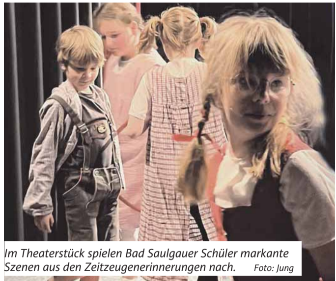
Im Theaterstück spielen Bad Saulgauer Schüler markante Szenen aus den Zeitzeugenerinnerungen nach.